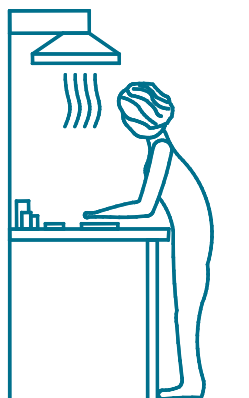
La mesa de preparación de mezclas.

Capta los contaminantes en una zona localizada. Puede ser necesario instalar estos sistemas para reducir vapores y/o polvo en: