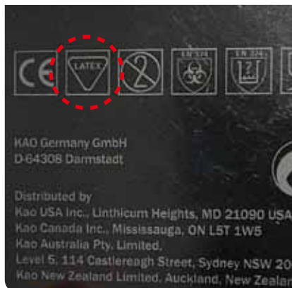
Látex de los guantes.