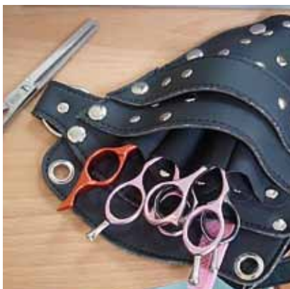
Níquel, en tijeras, navajas...