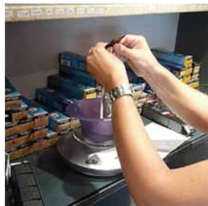
Componentes de los cosméticos, especialmente en los tintes (p-fenil-endiamina, formaldehído, resorcinol, hidroquinona).

La profesión de peluquero y peluquera es una de las más afectadas por la dermatitis alérgica